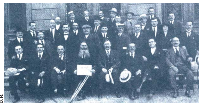
Une des premières photos de congrès : ici, à Limoges, en 1923. Création du « Mutilé du travail ».